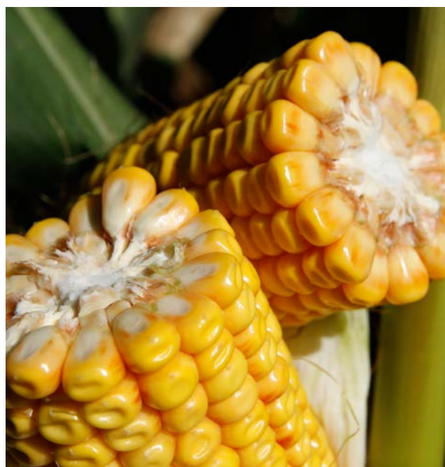
REJESTRACJA: SŁOWACJA 2014